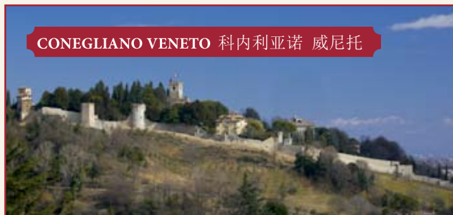
CONEGLIANO VENETO 科内利亚诺 威尼托