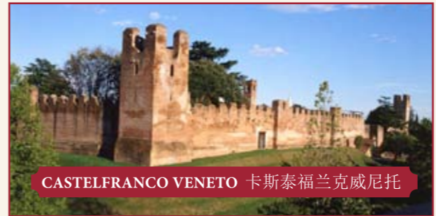
CASTELFRANCO VENETO 卡斯泰弗兰克威尼托