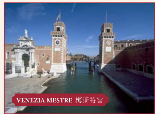
VENEZIA MESTRE 梅斯特雷