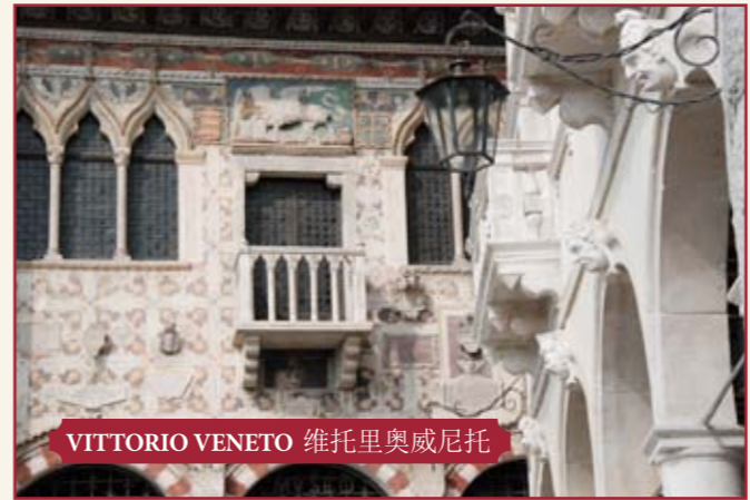
VITTORIO VENETO 维托里奥威尼托