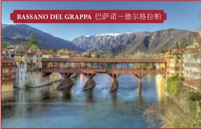
BASSANO DEL GRAPPA 巴萨诺-德尔格拉帕