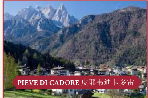
PIEVE DI CADORE 皮耶韦迪卡多雷