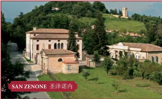
SAN ZENONE 圣泽诺内