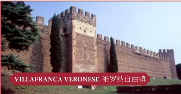
VILLAFRANCA VERONESE 维罗纳自由镇