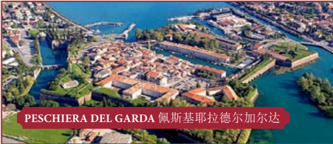
PESCHIERA DEL GARDA 佩斯基耶拉德尔加尔达