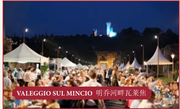
VALEGGIO SUL MINCIO 明乔河畔瓦莱焦