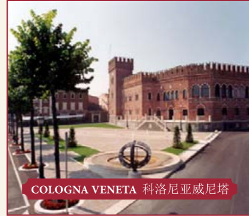
COLOGNA VENETA 科洛尼亚威尼塔